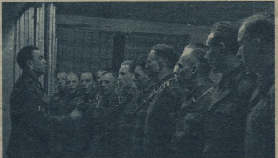
Latviešu ģ legiōnāru vokālais ansamblis diriģenta V. Melnbārža vadībā.