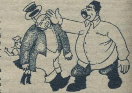
G. Zichmanes zīm. POĻU JAUTĀJUMS IZSKĪRTS.