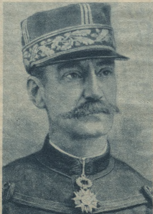
„Mani interesē tikai mērķis, līdzekļi ir jūsu lieta,” ģenerālis Galiēni mēdza teikt savam štāba šetam Liotejam.