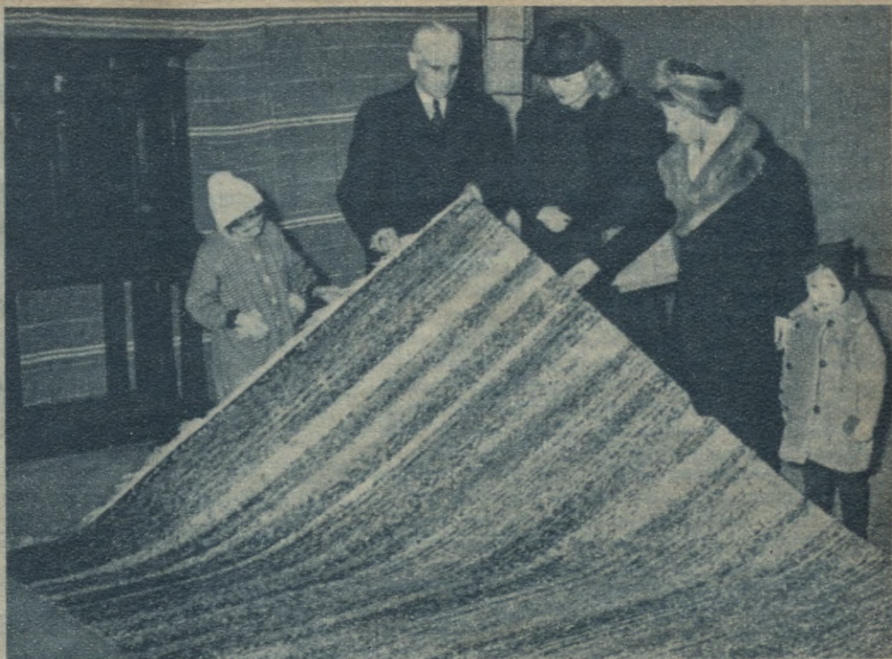
Kādā Berlīnes maiņas punktā lietpratēji novērtē maiņai nodoto paklāju.

Tomēr žurnālisti, kuŗu rokās nonāca šis raksts, aplūkoja šo lietu pavisam no cita