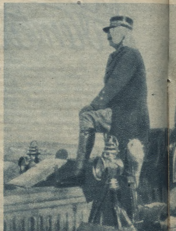
Ģenerālis Liotejs 1912. g. Marokā. Viņš bija Galiēni darba turpinātājs Francijas koloniju valsts izveidošanā.