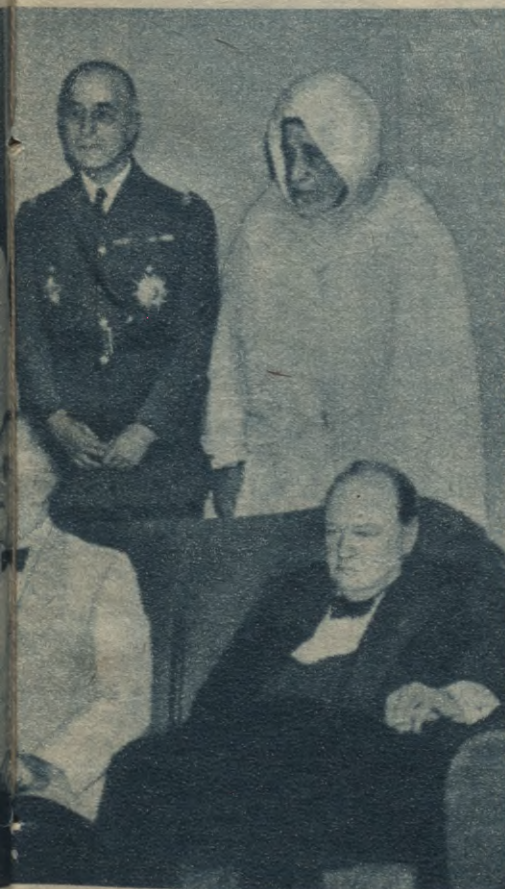
Amerikāņu ģenerālis Klarks, ko Ruzvelts sūlīja „iekaņot” Iranču Atriku, apspriežas ar kādu marokāņu virsaiti.

Jaunais Atrikas „saimnieks” Ruzvelts Kasablankas apspriedes laikā. No viņa pa kreisi Marokas sultāns, pa labi Čerčils, aiz muguras Ruzvelta diplomāts Mertijs, padomnieks Hopkins, sultāna troņmantnieks, Iranču ģenerālrizidents Noguē un sultāna ministrs. Šai uzņēmumā pat šejās saskatāms amerikāņu prieks un pašapziņa un Čerčila neapmierinātība, bet viņi vēl nezina, ka jaunais Atrikas kungs ir jau ceļā no Maskavas.